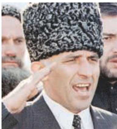
Ska det vara så svårt att samtala med varandra. Aslan Maschadov är folkvald tjetjensk ledare.

Frågan om Tjetjeniens självständighet kontra Rysslands territoriella integritet har nämligen sedan länge lagts till handlingarna.